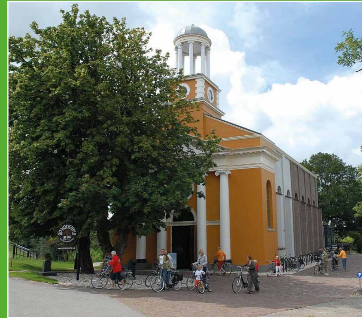
① Op Hodenpijl

Op Hodenpijl is een historische buitenplaats waar cultuur, kunst, gezondheid en welzijn bij elkaar komen. Proef de smaken van Midden-Delfland in het restaurant de Herdershof, bezoek een lezing, concert of expositie. Of kijk rond in de stal en de (moes-)tuinen die het restaurant voorzien van zuivel, vlees en groenten. Adres: Rijksstraatweg 20-22, Schipluiden. Open: di t/m zo vanaf 10.00 uur.