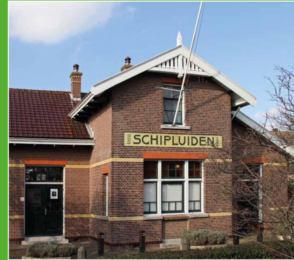
② Museum Het Tramstation

Op Hodenpijl is een historische buitenplaats waar cultuur, kunst, gezondheid en welzijn bij elkaar komen. Proef de smaken van Midden-Delfland in het restaurant de Herdershof, bezoek een lezing, concert of expositie. Of kijk rond in de stal en de (moes-)tuinen die het restaurant voorzien van zuivel, vlees en groenten. Adres: Rijksstraatweg 20-22, Schipluiden. Open: di t/m zo vanaf 10.00 uur.