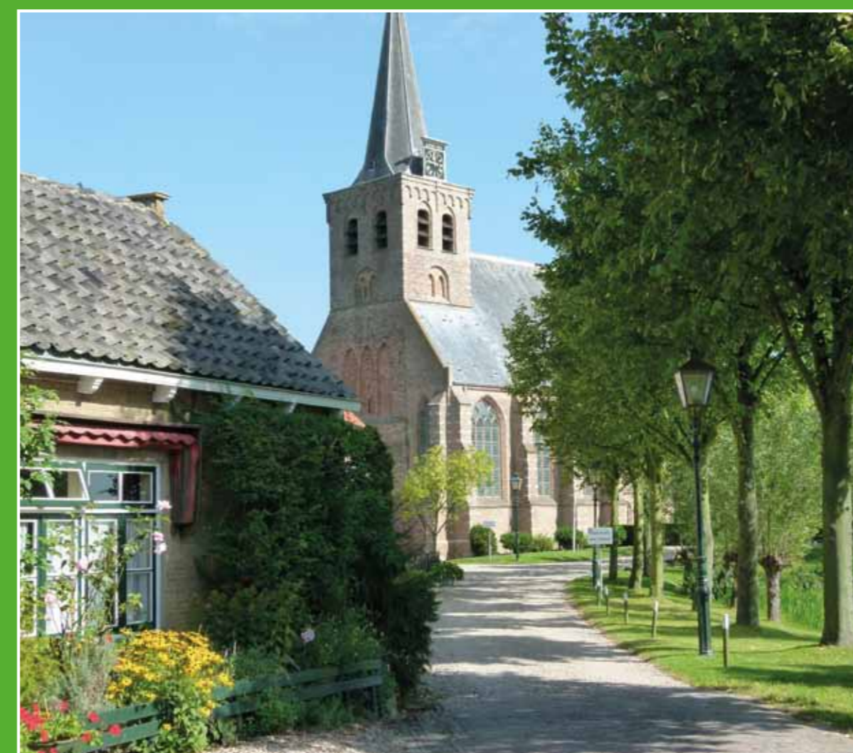
③ 't Woudt

't Woudt is het kleinste dorp van Nederland en ligt in het open veenweidegebied van de Woudsepolder. 't Woudt is rijk aan cultuurhistorie. De kerk, een rij huisjes, drie boerderijen, een historische tuinmuur en koffiehuis De Hooiberg liggen aan een mooie fietsroute door Midden-Delfland. Het buurtschap heeft door zijn unieke karakter en ligging een beschermd dorpsgezicht.