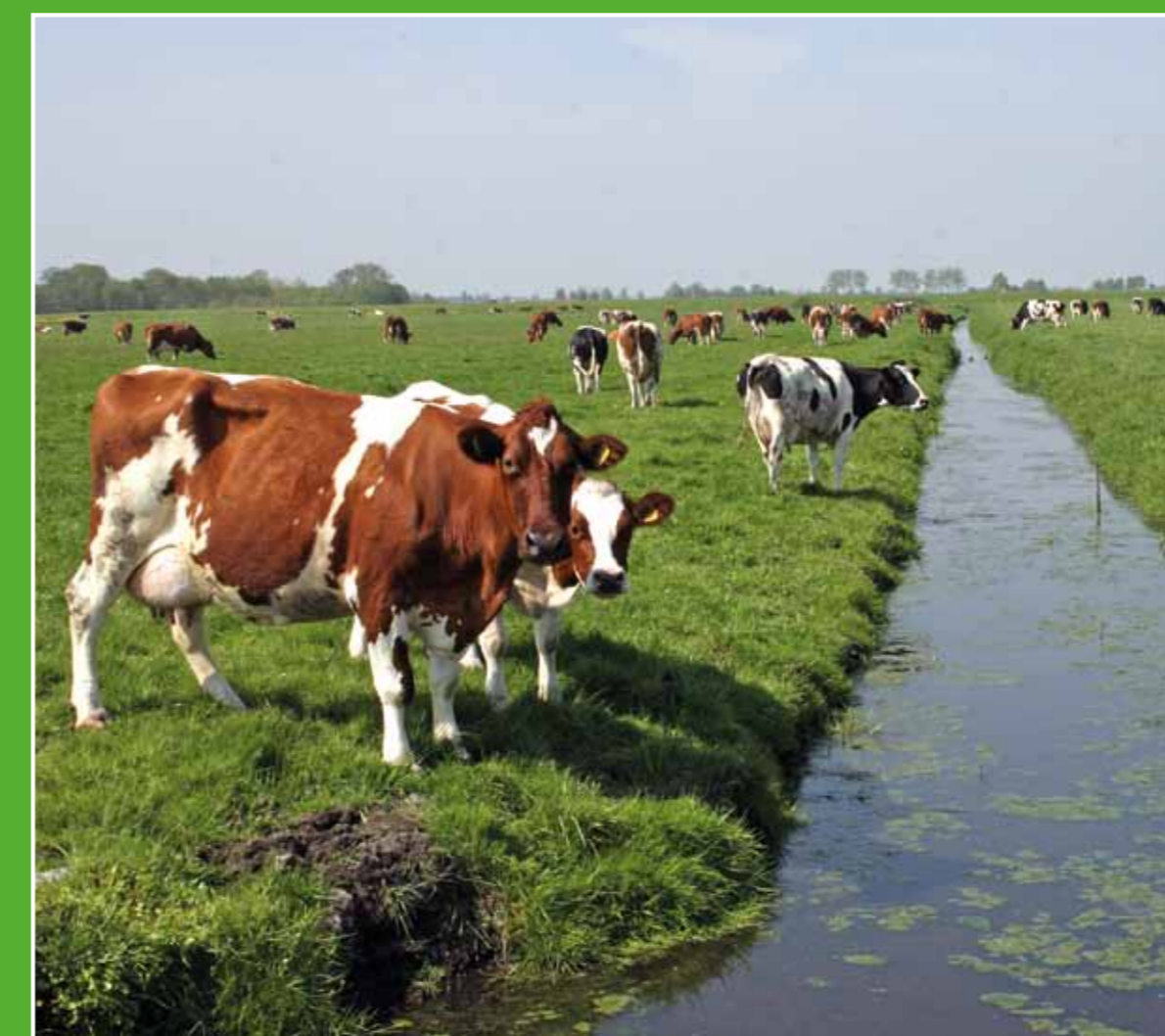
④ Oude Tanthofkade

't Woudt is het kleinste dorp van Nederland en ligt in het open veenweidegebied van de Woudsepolder. 't Woudt is rijk aan cultuurhistorie. De kerk, een rij huisjes, drie boerderijen, een historische tuinmuur en koffiehuis De Hooiberg liggen aan een mooie fietsroute door Midden-Delfland. Het buurtschap heeft door zijn unieke karakter en ligging een beschermd dorpsgezicht.