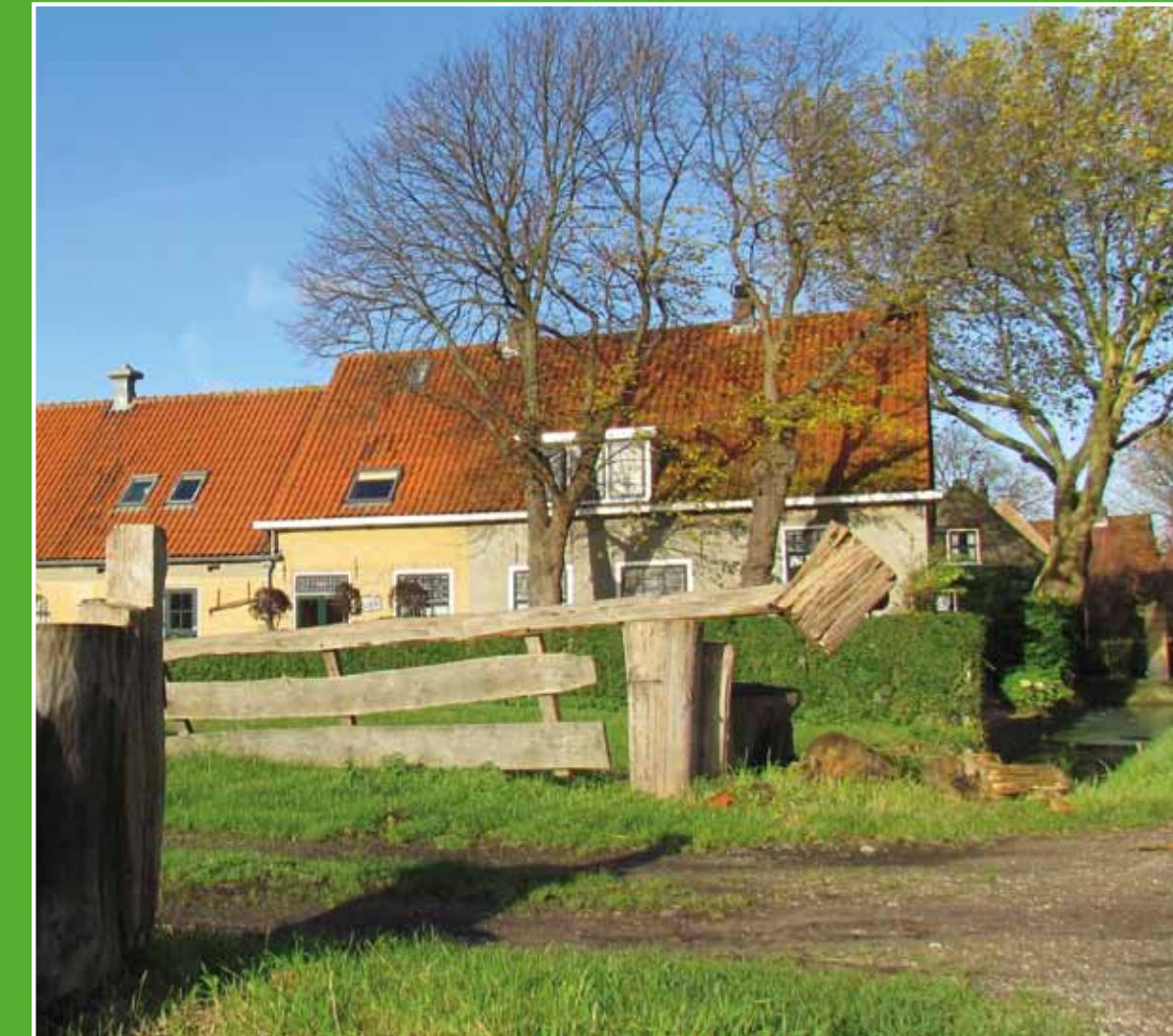
② Klein Delfgauw

Het Krekengebied in het Bieslandse Bos ligt veel lager dan de omliggende polder, omdat hier in het verleden turf is gestoken. Het moerassige gebied is na de uitgraving van het veen beplant met bomen en wordt beheerd door Staatsbosbeheer. Er is een overvloed aan eten en vele mogelijkheden voor nestplaatsen; een waar paradijs voor vogels. De Kreken wandelroute laat u het gebied intiem beleven en misschien komt u dan wel grazende Galloway runderen of IJslandse paarden tegen.