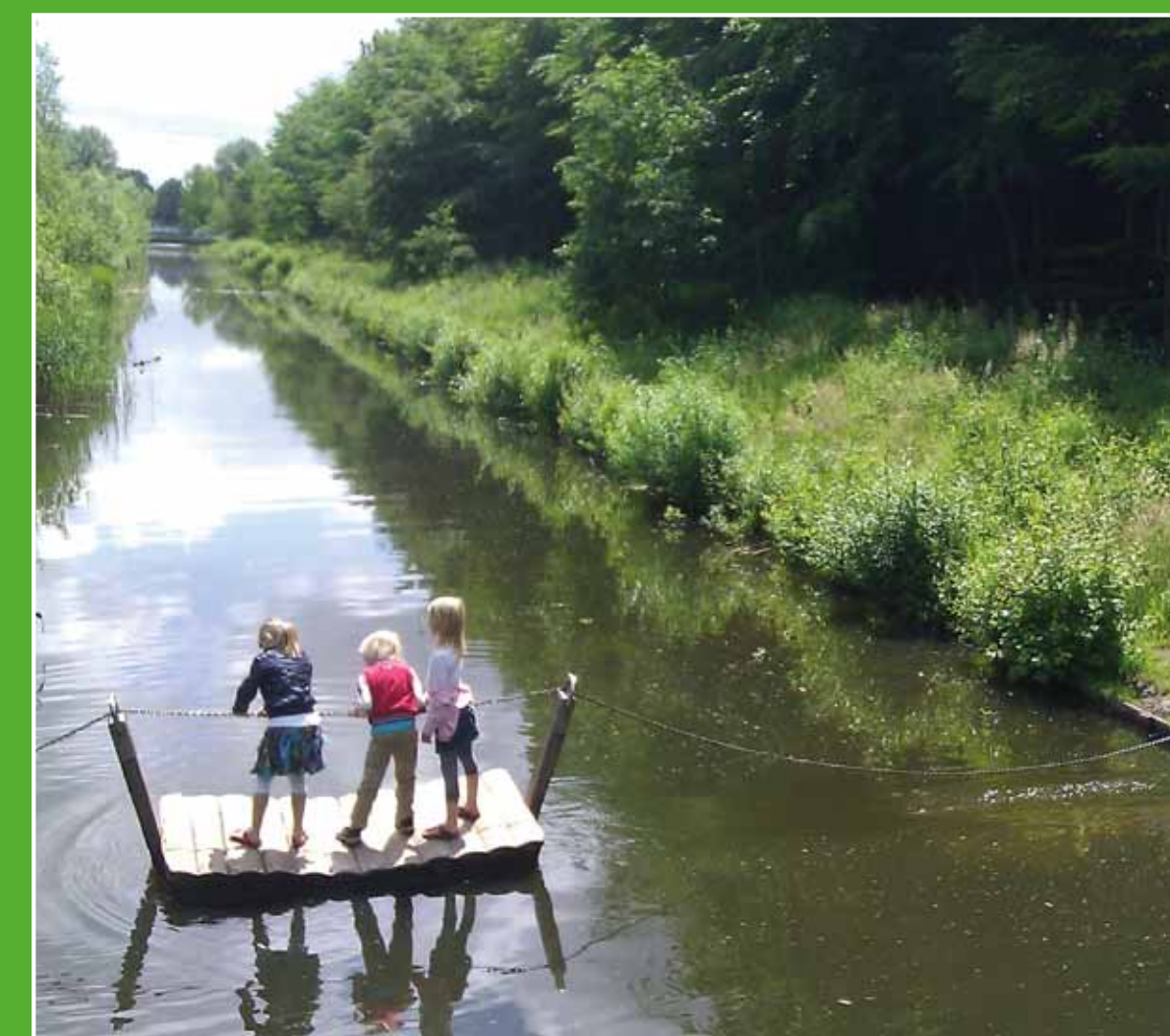
④ De Balij

U kunt alles ontdekken over de natuur en het milieu in informatiecentrum De Papaver, dat ligt in het natuur- en recreatiegebied De Delftse Hout. In dit gebied liggen ook een kinderboerderij met waterspeeltuin, een heemtuin, een hertenkamp en een hoge bosrijke heuvel, de Berg van Zegwaard. Voorheen was dit een afvalstortplaats. Adres infocentrum: Korftlaan 6, Delft. Telefoon: 015-2197985