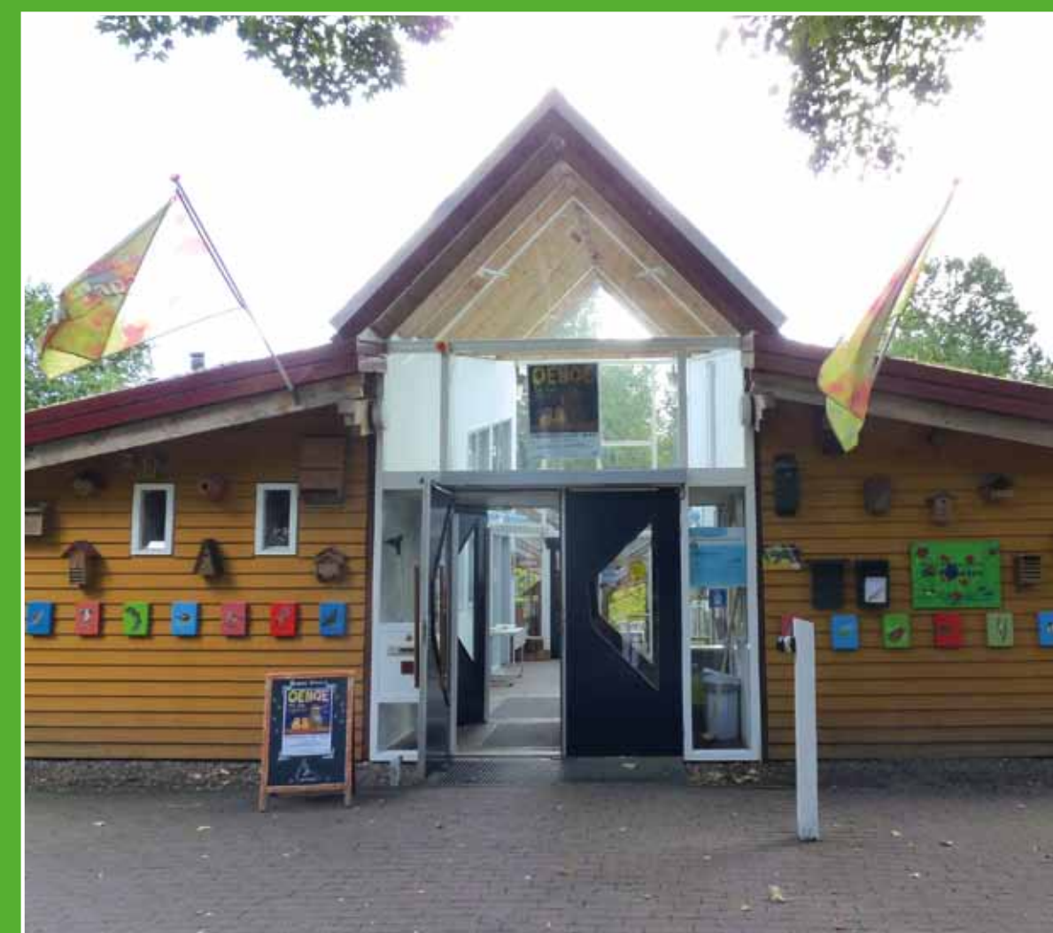
③ Informatiecentrum De Papaver

Het oude buurtschap Klein Delfgauw vormt een mooi lint tussen de weilanden. Door inklinking en het turfsteven van het omliggende land, ligt het lint als een verhoging in het landschap. Het biedt zo prachtige vergezichten over de veenweides. Het buurtschap is een gezellige plek voor een hapje en een drankje.